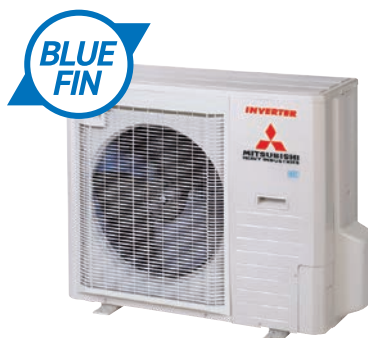
FDC 90 VNP-W (3,5HP) FDC 100 VNP-W (4HP)