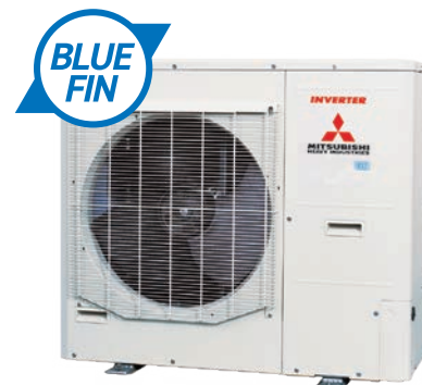
FDC 125 VNP-W (5HP)