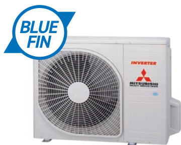
FDC 71 VNP-W (3HP)