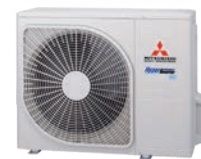
SRC 50-60 ZSX-W3