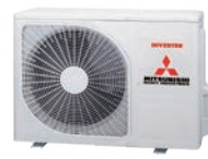
SRC 25-35 ZS-W2