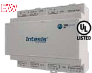
IN776MHIO0S0000 IN776MHIO0M0000 IN776MHIO0L0000