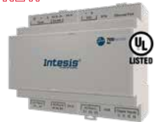
IN776MHIO0S0000 IN776MHIO0M0000 IN776MHIO0L0000