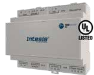
IN776MHIO0S0000 IN776MHIO0M0000 IN776MHIO0L0000