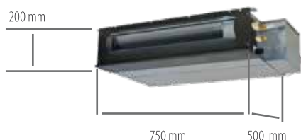
modelli FDUT 15, 22, 28, 36 KXE6F-E