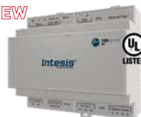
IN776MHIO0S0000 IN776MHIO0M0000 IN776MHIO0L0000