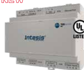
IN776MHIO0S0000 IN776MHIO0M0000 IN776MHIO0L0000