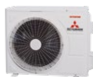
SRC 25~35 ZSP-W