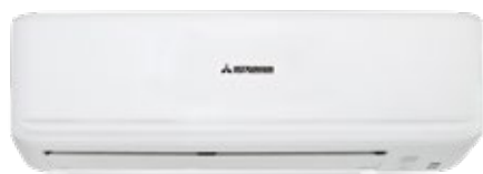
SRK 25~50 ZSP-W