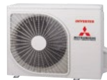
SRC 45~50 ZSP-W